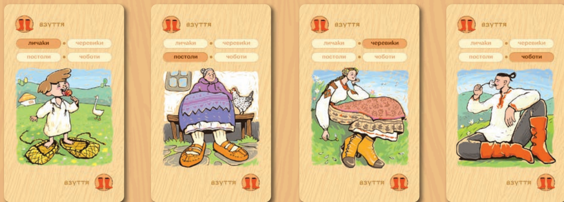
ЗІБРАННЯ (колекція) з 4 карток

ВАЖЛИВО! Серед карток ПРЕДМЕТІВ СПАДЩИНИ є 3 особливі картки, які не формуються у ЗІБРАННЯ (колекції). Це картки ХЛІБ, ПІВЕНЬ та ЗЛИДНІ. Вони мають особливі властивості, які ми розглянемо згодом.